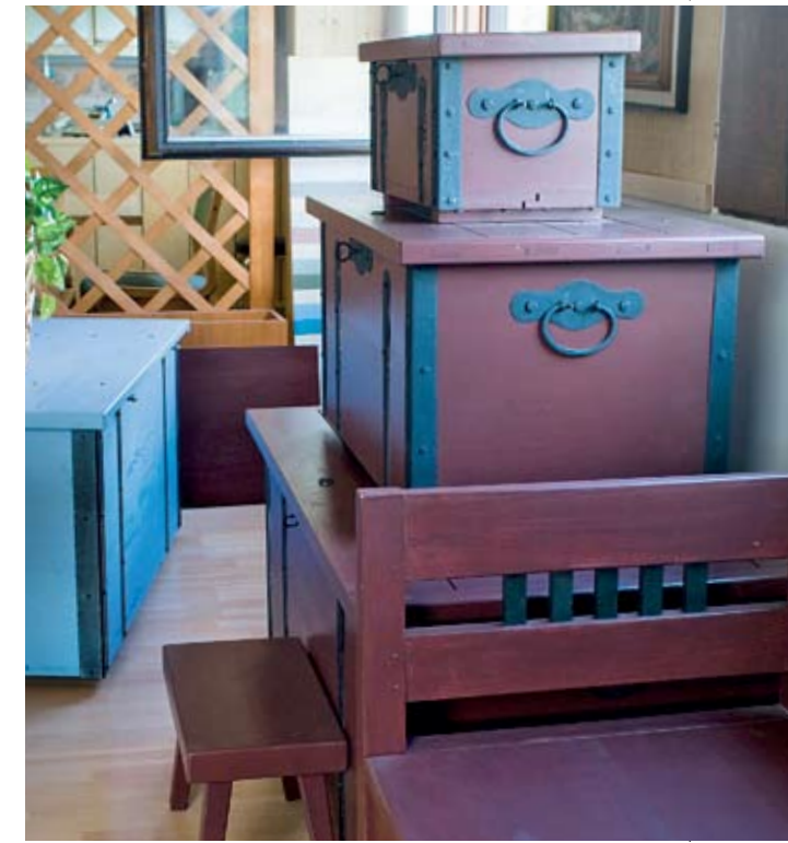
Talonpoikaistyylinen Wakka on yksi Niemen Tehtaiden uusimmista tuotesarjoista.