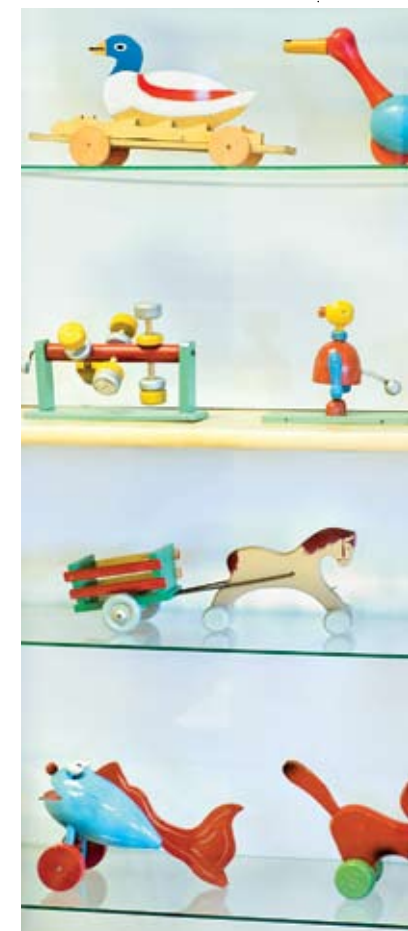
Puulelut ovat osa Niemen Tehtaiden historiaa.

”Jos jää lepäämään laakereilleen, peli on menetetty. Me haluamme olla aktiivisia ja pärjätä. On-han meillä valttina suomalainen puu, josta tehtyjä huonekaluja kelpaa markkinoida niin Suomeen kuin muualle maailmaan.”