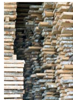
Taapeleissa laatu puu saa kuivua rauhassa.