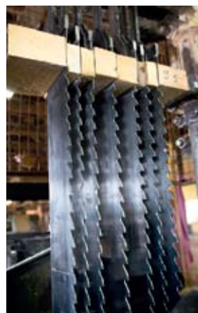
Tukit sahataan Niemen Tehtaiden omalla sahalla.