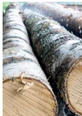
Materiaaliksi kelpaa vain oksaton, suora tyvitukki.

Niemen Tehtaat on Suomen vanhin huonekaluvalmistaja. Perheyriksen johdossa on jo neljäs sukupolvi ja puunhankinta on omissa käsissä. TEKSTI: TIINA LAANINEN